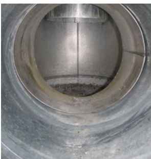
Inkijk in inspectieluik CLV systeem