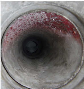
Inkijk in RGA aansluiting